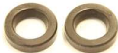
メーターリングオイルポンプ シャフトオイルシール