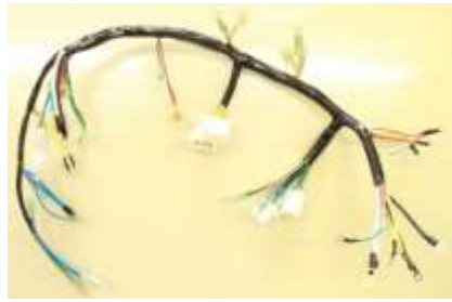
ダッシュハーネス