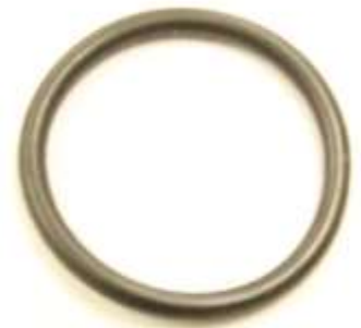
デスビOリング 1個 ¥390-