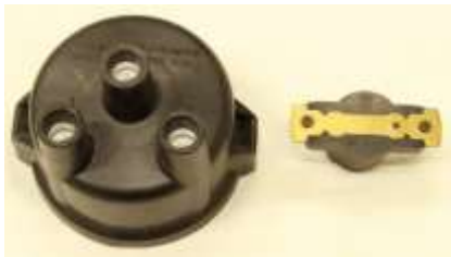
デスビキャップ 1個 ¥4,630-