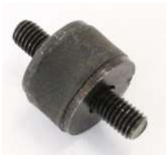
オイルクーラー取付