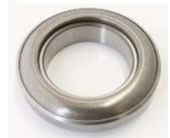
リリースベアリング