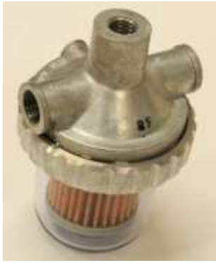
燃料フィルターボディ Assy ¥3,850-