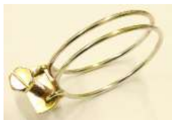
ラジエーターホースバンド

6角マイナス頭でナットプレートも打ち抜きの当時と同じ懐かしいクランプです。1個 ¥3,500-