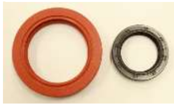
エキセントリックシャフト