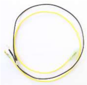
タンクゲージハーネス