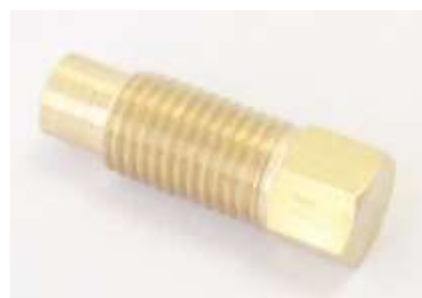
ラジエータードレンコック