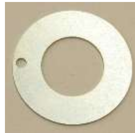
ナットロックプレート