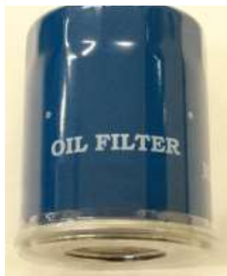
オイルフィルター