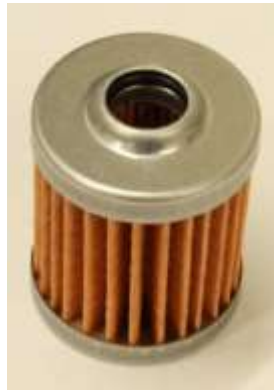
燃料フィルター単品 ¥880-