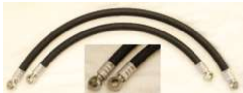
オイルクーラーホース