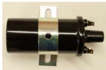
抵抗内蔵イグニッションコイル