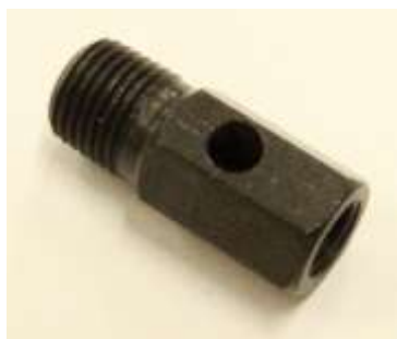
ドレンコックアダプター