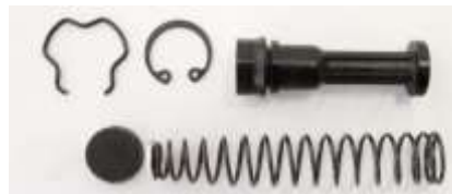
クラッチマスター