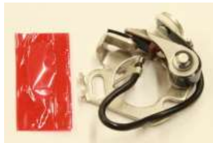
コンタクトポイント