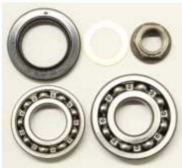
リアアクスルベアリングセット

ハコスカ、ケンメリ、ブルーバ ード 510・610 共通 厚さ 4.5mm 55477-21000 厚さ 1.0mm 55478-21000 各1枚¥880-