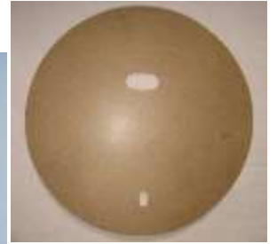
スペアタイヤボード