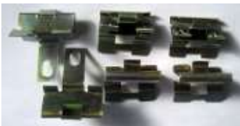
モールフック (前後別形状)

ボンネットとトランクに付くモールの止めるフックです。前後共に外側 2 個 (左) と中側 4 個 (右) が必要です。