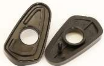
ミラープラスチック台座

ミラーの足とボディの間のプラスチック製の台座です。左右で違うので取り付けの際は気をつけて下さい。前期ミラー用