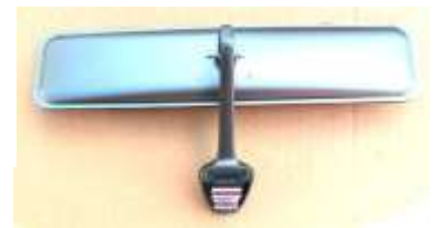
レース用ワイドミラー