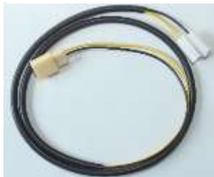
タンクゲージハーネス

残量警告灯が無い2線タイプの燃料センサーとシート後のコネクターまでのハーネスです。