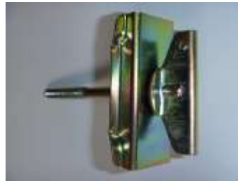
スペアタイヤ固定具

スペアタイヤを固定する金具です。これが無いとタイヤが暴れてボディを傷つけてしまいます。