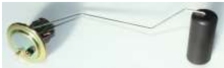
燃料タンクゲージ

残量警告灯が無い2線タイプの燃料センサーです。メーターの表示がおかしい場合は怪しいです。48年10月までの車両に適合します。少量生産のためお早めに！