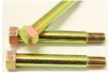
スイングアームピン

ブッシュ下の円盤の様なワッシャーの 下につく分厚いワッシャーです。 55463-21000 (55463-S0600) ハコスカ、ケンメリ、ブルーバード 510・610 共通 1枚¥1,200-