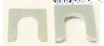
デフマウントスペーサー

・55226-21000 (55226-U0100) スカイライン (GC10~HGC210) ブルーバード (510~910) フェアレディ Z (S130) ・55226-W1200 (条件付で使用可能) R30 前期、C31、Z31、F30、S12 1本¥3,880-