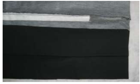
2ドア用ヘッドライニング