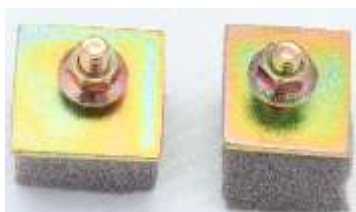
フロントコーナーモールフック

フロントコーナーのモールの止める金具です。上側幅広、下側幅狭の 2 種類あります。 1 個 ¥2,800