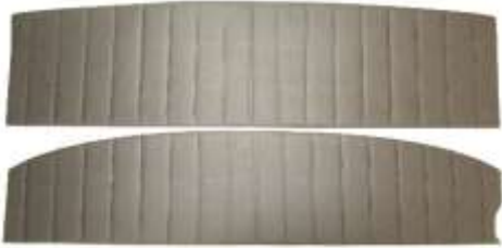
スピーカーボード 新商品!!

2ドア（上）と4ドア（下）の設定有り。標準は黒色です。他色は問い合わせ下さい。スピーカーの穴は必要に応じて開けて下さい。