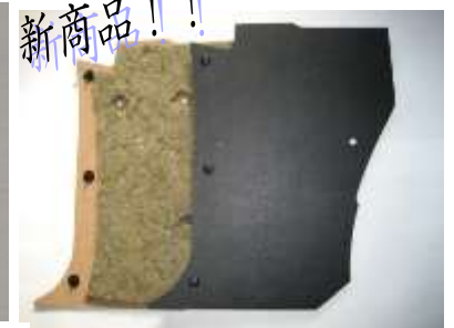
ダッシュサイドバッフル