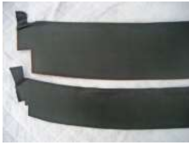
リアガラスアンダートリム

タンクゲージOリング、 ロックプレート 燃料フィルターL字6Φ、8Φ、 コの字（GTR用） 価格はお問い合わせ下さい。