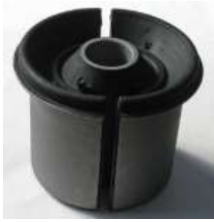
リアサスペンション メンバーブッシュ

左右セット¥30,000- ブーメランみたいなリアサス メンバーの両端につく大きいブ ッシュです。純正比 120%強化し てあります。他車流用可能? 取り付けの際は割れ目が前後に なるようにしてください。