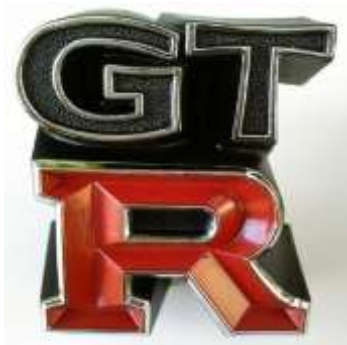
GTR 用フロント グリルエンブレム

フロントグリル向かって右側のブラケットにネジ止めで付けてください。 ¥9,660-