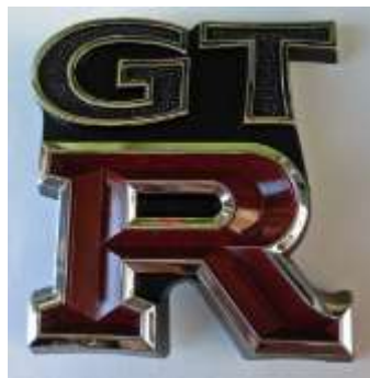
GTR 用リアガーニッシュ エンブレム

フロントグリル向かって右側のブラケットにネジ止めで付けてください。 ¥9,660-