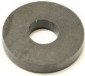
リアサスペンションメンバー マウンティングフロアワッシャー

左右セット¥30,000- ブーメランみたいなリアサス メンバーの両端につく大きいブ ッシュです。純正比 120%強化し てあります。他車流用可能? 取り付けの際は割れ目が前後に なるようにしてください。