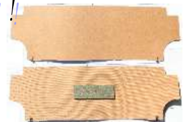
トランク仕切り板

トランクと燃料タンクを仕切る板です。上側にクランプがあるので先に嵌めてから下側はネジで止めます。全車共通です。84920-R3000（R3001、R5701）相当 ¥16,500-