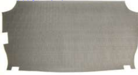
トランクビニールマット